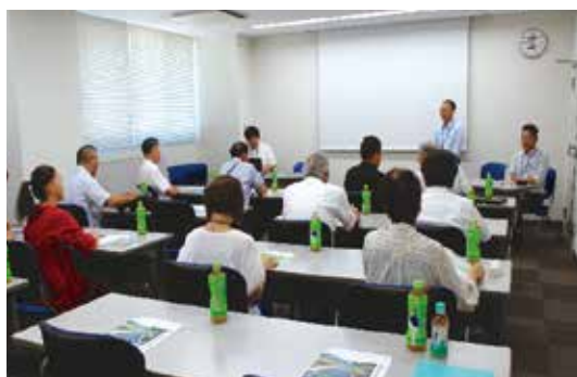
豊川総合用水土地改良区役員研修