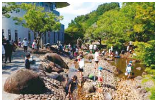
香川用水記念公園 水辺の納涼祭