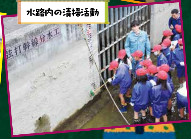
水路内の清掃活動