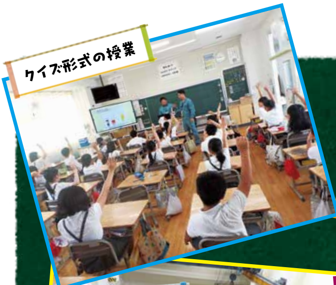
クイズ形式の授業