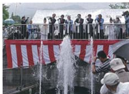
第30回香川用水水口祭