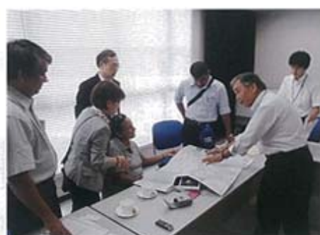
日本・スリランカ技術交流