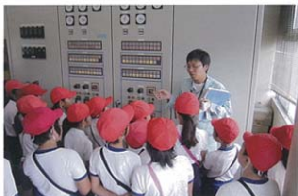
東部幹線揚水機場内操作室の説明(富田・松尾小学校)