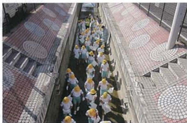
開水路内の清掃(大野小学校)