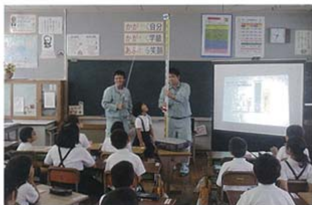
測量機器を用いた雨量の説明(豊田小学校)