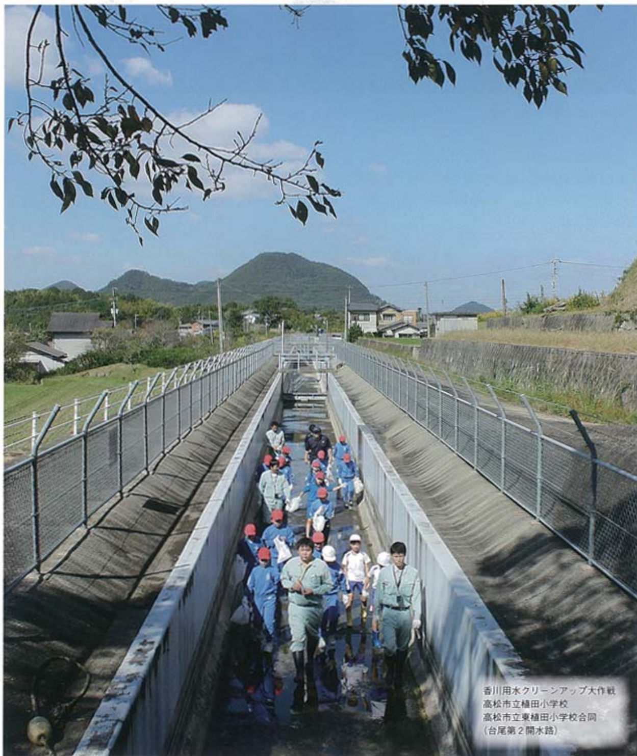
香川用水クリーンアップ大作戦 高松市立植田小学校 高松市立東植田小学校合同 (台尾第2開水路)

発行日 平成26年11月25日 発行所 香川用土地改良区 香川県高松市 番町2丁目4番27号 TEL087(822)0155 FAX087(823)8369 発行人 鈴木登美雄