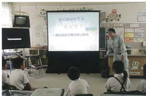
クイズ形式での授業(河内小学校)